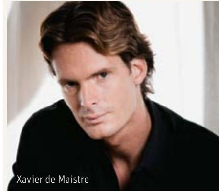
Xavier de Maistre